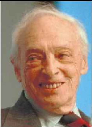
סול בלו. כיוון גבוה